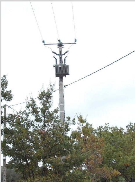
Poste H 61