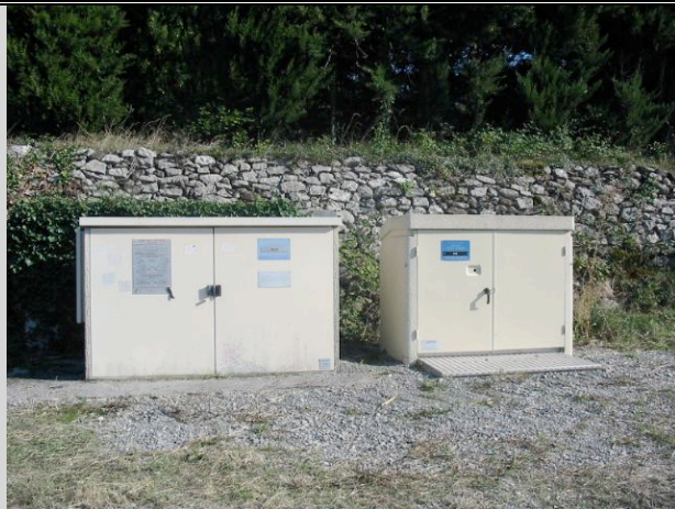
PSSB et PSSA