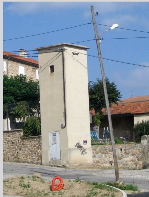
Poste cabine haute